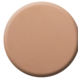
P70 PVD Rose Gold