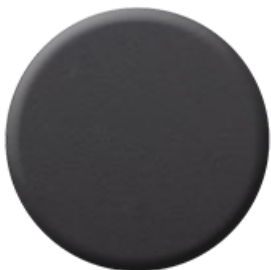
N7 Nero Soft Touch Black Soft Touch