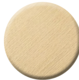
C41 Brushed Gold