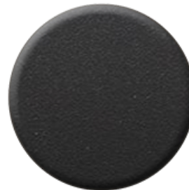
N1 Nero Opaco Goffrato Embossed Matt Black