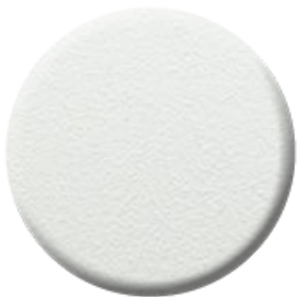
W1 Bianco Opaco Goffrato Embossed Matt White