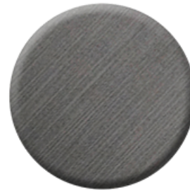
C51 Brushed Metal Black