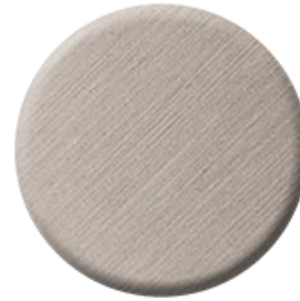
C3 Brushed Nickel