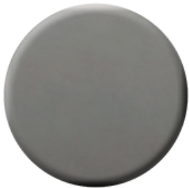
C50 Metal Black